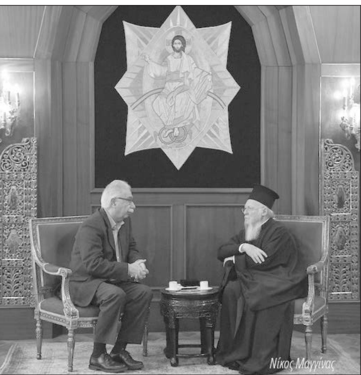
Ο Υπ. Θρησκευμάτων επέλεξε να μη παραστή εις τήν βράβεισιν τής Ιεραρχίας, αλλά να μεταβή εις τό Φανάρι.

Ευθεία έπίθεσις -και Ύπουργών- μέ ύπονοούμενα άκόμη και δια τόν ρόλον τής Έκκλησίας κατά τήν Κατοχήν, έπειδή άποτελεί έμπόδιον εις τά διεθνιστικά σχέδιά των δια τó Σκοπιανόν και τά Θρησκευτικά.