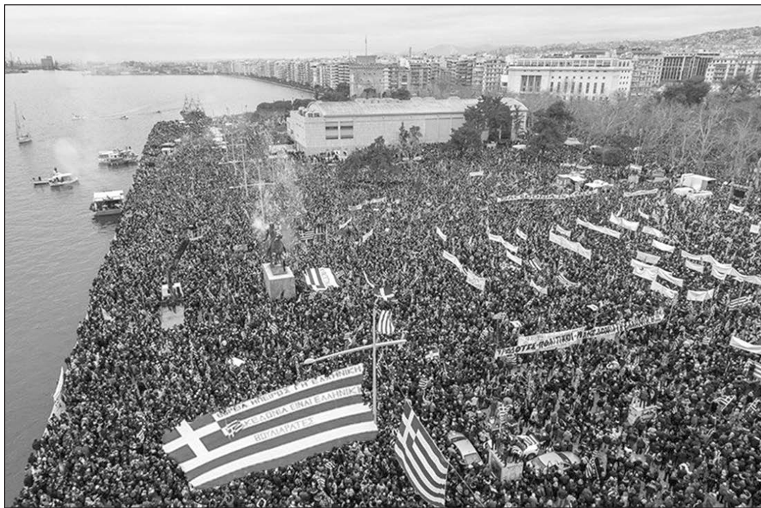
Συγκινητικὸν ἐκ τοῦ μεγαλειώδους συλλαλητηρίου διὰ τὸ Σκοπιανόν εἰς Θεσσαλονίκην