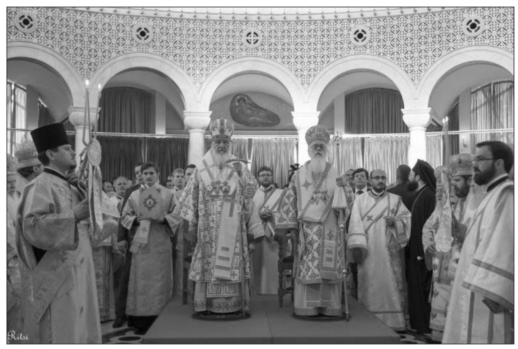
Ἀπὸ τὸ συνέλευρον τοῦ Πατριάρχου Μόσχας μὲ τὸν Ἀρχιεπίσκοπον Ἀλβανίας (30.04.2018).