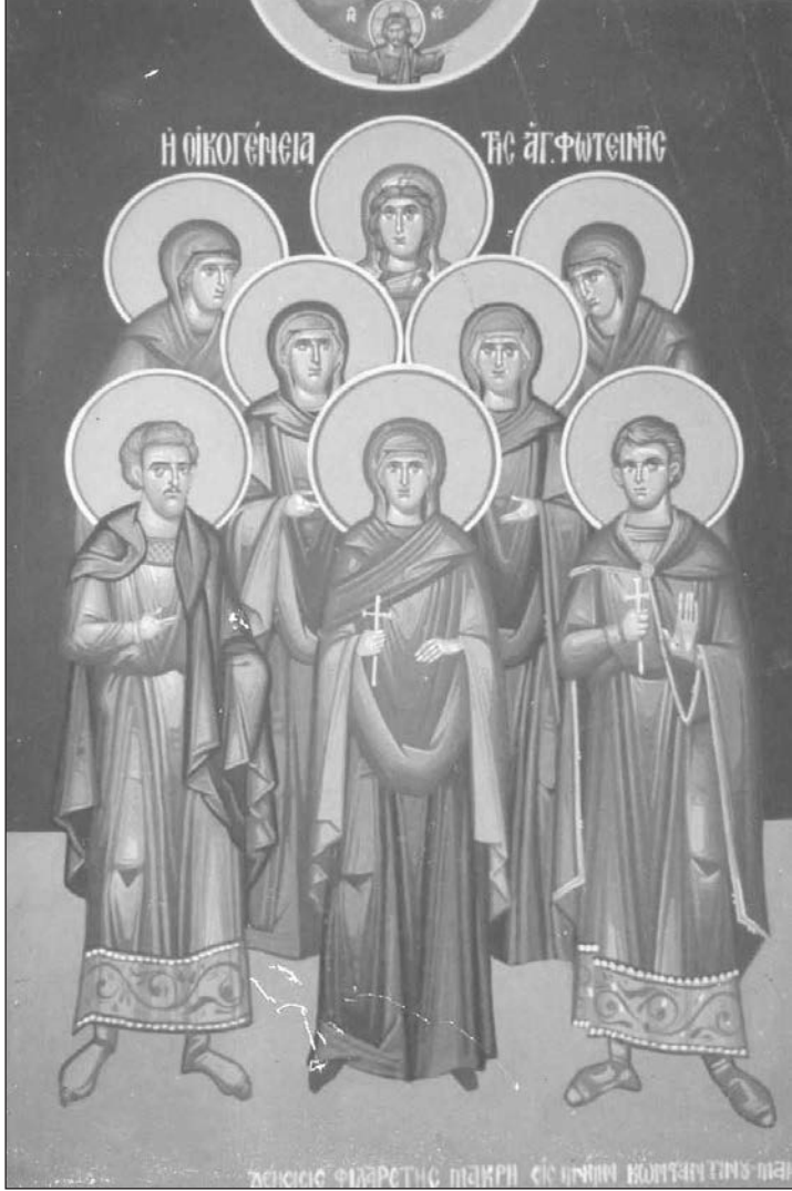
Τὴν 26ην Φεβρουαρίου ἡ Ἐκκλησία μας τιμᾷ τὴν μνήμη τῆς Μεγαλομάρτυρος Ἁγίας Φωτεινῆς τῆς Σαμαρείτιδος.