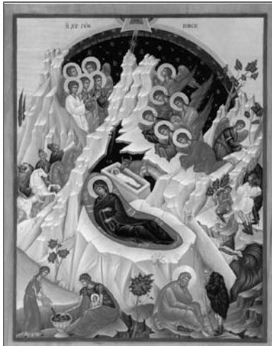
Ανατολήν, Κύριε δόξα σοι... Πρωτ. Δ.Δ.Τ.

ΣΤΙΣ 25 Δεκεμβρίου η Έκκλησία μας εορτάζει τή γέννηση τού Σωτήρος Χριστού. Είναι μεγάλη και χαριόσυνη η ημέρα, γιατί ο Θεός στέλνει τό μονογενή του Υίο στη γη για τή δική μας σωτηρία.